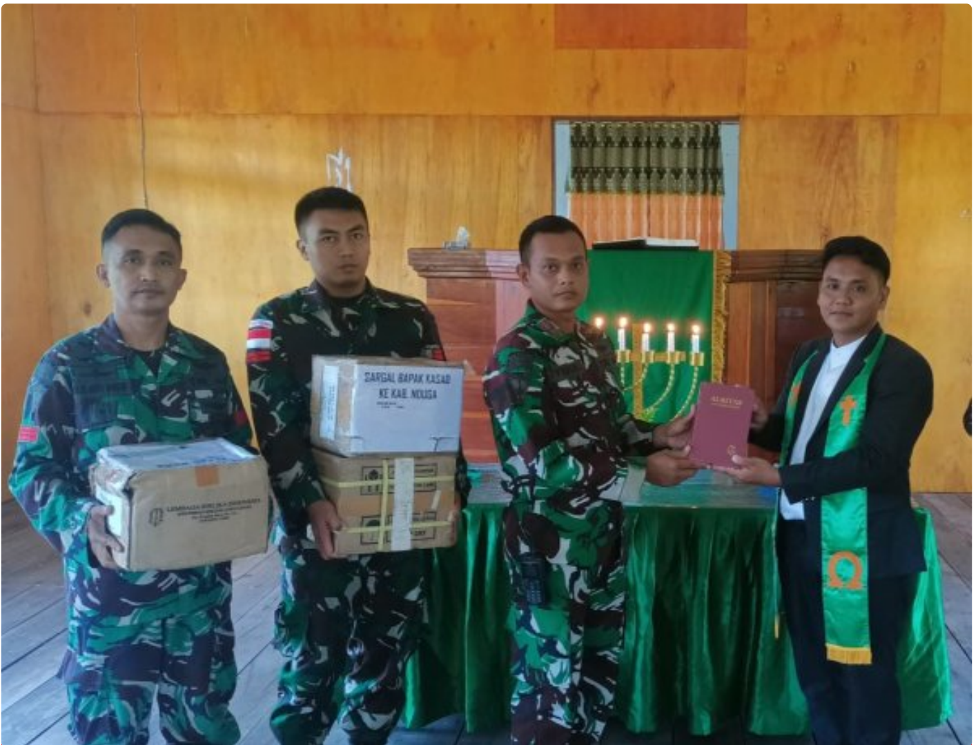
Foto: Satgas Yonif 503/Mayangkara kembali menunjukkan dedikasinya kepada masyarakat di Papua dengan memberikan dukungan alat musik untuk kegiatan ibadah di Gereja GKI Bethesda Batas Batu, Distrik Krepkuri, Kabupaten Nduga. Pada Minggu, 12 Januari 2025.

NDUGA- Satgas Yonif 503/Mayangkara kembali menunjukkan dedikasinya